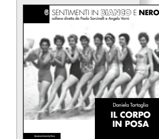
◁ © Daniela Tartaglia Assoluto 6.

Il corpo in posa , pagine 112, formato cm 23,5x23,5, Bononia University Press, Bologna 2011, Euro 23,00.